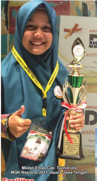
Medali Emas Cab. Tauhid Ula MQK Nasional 2017 Jepara Jawa Tengah

mendatang. Sistem pengajaran yang "fun Learning" dengan Kurikulum Nasional dan Kepondokan yang berbasis Kitab Kuning membawa santri tidak jenuh dalam menerima setiap pelajaran yang diberikan. Alhamdulillah per 2018 jumlah santri meningkat drastis dengan jumlah 1500 orang yang berasal dari Sabang sampai Merauke dan Luar Negeri. Ponpes Sumatera Thawalib Parabek Bukittinggi ke depan akan tetap pada komitmen awal, yaitu mencetak kader-kader ulama mapan dalam beribadah, intelektual dalam berfikir dan terampil dalam bermasyarakat.